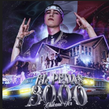
EL PEDAS 3000