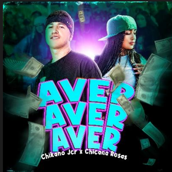
A VER A VER A VER

HAZ CLICK EN LAS PORTADAS PARA VER LOS VIDEOS