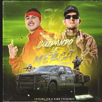
CUIDANDO LA MERCA